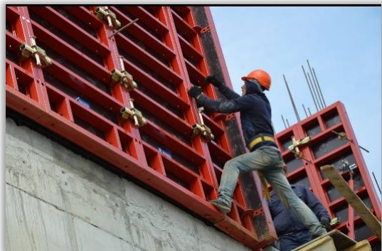
Монтаж и демонтаж опалубки монолитных железобетонных конструкций