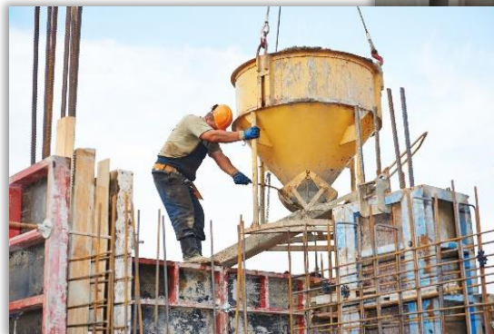
Бетонирование по схеме "кран-бадья"