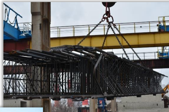
Установка арматурных изделий