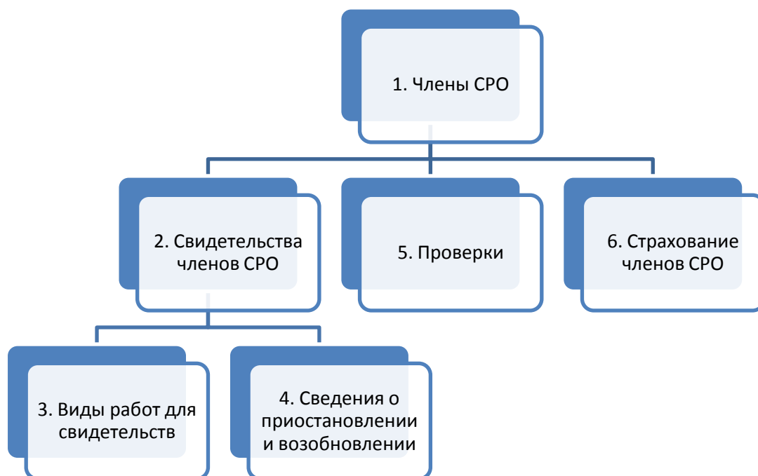
Рисунок №1. Структура таблиц

Краткая иерархия таблиц выглядит, как показано на рисунке №1. Нумерация Таблиц соответствует рекомендуемой очередности заполнения данных.